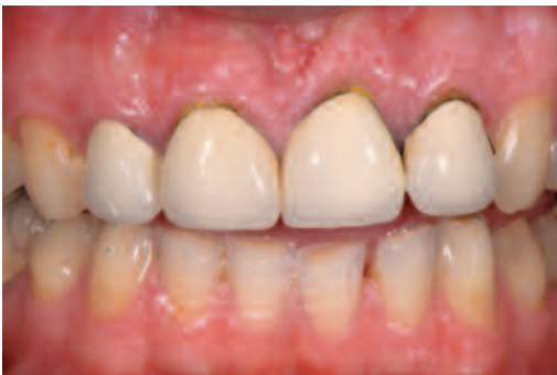
Ausgangssituation für einen Kursfall mit Patient