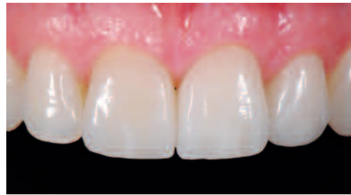
Zwei invasive und ein Non-Prep-Veneer in situ

Die technischen Abläufe der Kurse werden fotografisch dokumentiert, wobei Grundsätze der Kamerahandhabung erläutert werden. Des Weiteren wird ein Rot-Weiß-Ästhetikkurs vorbereitet, dessen Ziel es ist, Gumshades und Zahnkeramik auf Zirkoniumdioxid in naturnaher Wirkung zu verbinden. Die Fortbildungsreihe soll die