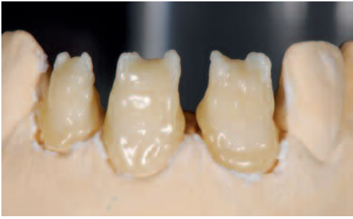
Powercore-Layering im Short Ways-Big Action-Kurs