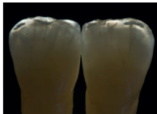
Freie Handhabung von Dentalkeramik im Interaction-System