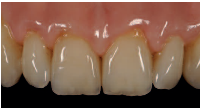
Rot-weiße Ästhetik auf Zirkoniumdioxid