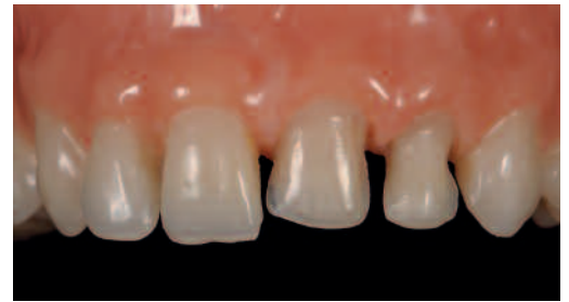
Modellfall des Veneerkurses

Fähigkeit zum selbständigen Umgang mit Dentalkeramik sowie die freie Handhabung des Interaction-Systems vermitteln.