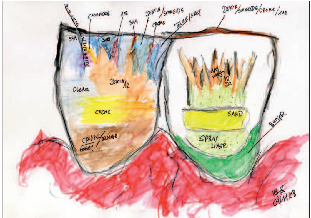
Individuelles Schichtschema, individuell dokumentiert