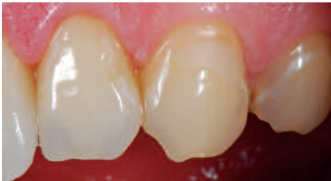
Einprobe einer Zirkonkrone des selben Falles